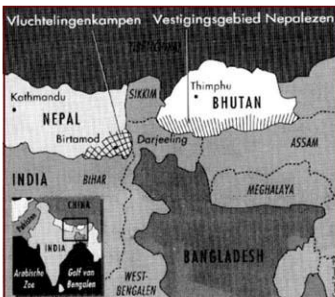
Plaats van de vluchtelingenkampen in Nepal

In de vluchtelingenkampen verschaffen United Nations High Commissioner for Refugees (UNHCR) en een aantal International Non-Governmental Organizations (ingo's) aan de vluchtelingen primaire voorzieningen, zoals onderdak, onderwijs, voedsel en medische voorzieningen. Verder geven zij ondersteuning aan de lokale gemeenschappen rond de kampen in de vorm van rarp-projecten (Refugee Affected Areas Rehabilitation Programme). UNHCR zal tevens helpen bij het uitvoeren van een mogelijke oplossing voor dit vluchtelingenprobleem, waarover Nepal en Bhutan al sinds 1993 in overleg zijn via een reeks van multilaterale onderhandelingen, met onder andere India als derde partij.